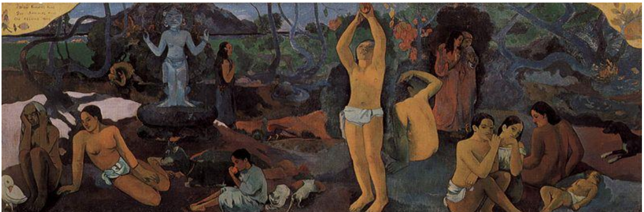
Paul Gauguin, Skąd przychodzimy? Kim jesteśmy? Dokąd idziemy? [w:] Sztuka świata, t.9, Wydawnictwo Arkady 1996, s.44.

Odwołując się do treści i kompozycji obrazu Paula Gauguina, wyjaśnij tytuł - Skąd przychodzimy? Kim jesteśmy? Dokąd idziemy?