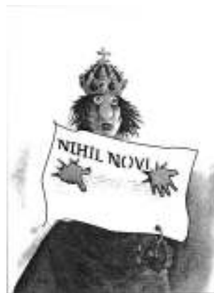
Poczet władców polskich według Jujki

Przyjrzyj się zamieszczonej ilustracji i wykonaj polecenia.