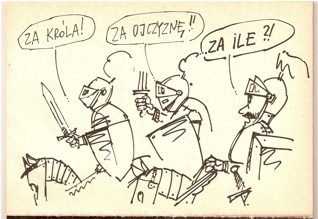
H. Sawka Boże, Toś Polskę!