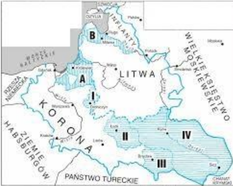
Rzeczpospolita Obojga Narodów w 1569 r.