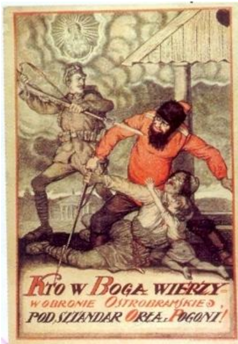
Plakat-1920, MNEP Warszawa, fot. MM

Przeanalizuj zamieszczone źródło ikonograficzne i posiłkując się wiedzą pozaźródłową odpowiedz na pytanie.