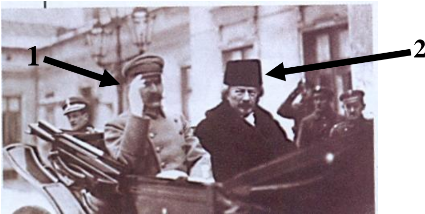
W drodze na poświęcenie Sali obrad sejmu, Warszawa 19 II 1919, AAN Warszawa.

Przeanalizuj zamieszczoną ilustrację i posiłkując się wiedzą pozazródłową wykonaj polecenia.