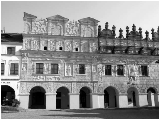
ilustr. 1 .....

11. Ilustracjom obiektów przyporządkuj styl architektoniczny, w którym zostały wybudowane. Wybierz spośród podanych niżej określeń: barok, gotyk, klasycyzm, renesans, rokoko, romanizm.