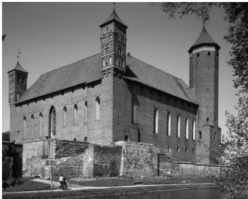
ilustr. 3 .....