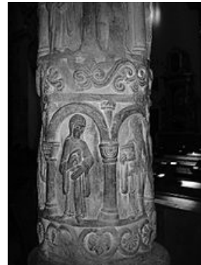
ilustr. 2 .....